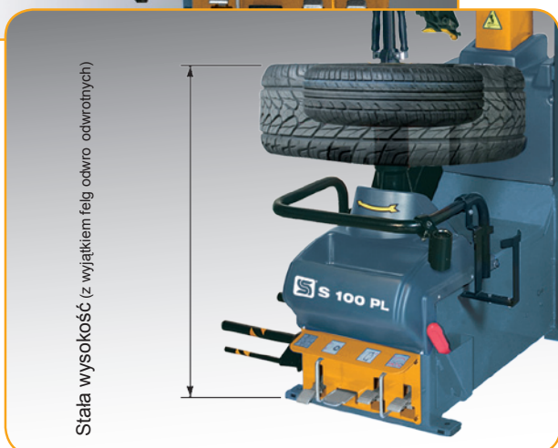
Stać wysokość (z wyjątkiem felg odwróconych)